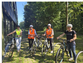
All DPIET teams, Departement of heritage and property management